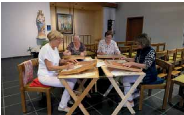
Die Zithergruppe Alegra gestaltete die Gottesdienste musikalisch.

ist ein integratives Modell, das von Seiten der Behindertenseelsorge jederzeit unterstützt wird. Weiter wurden auch im vergangenen Schuljahr mehrere Schüler der Sprachheilschule Guintzet ganz selbstverständlich in ihren Heimatpfarreien für die Vorbereitung und Feier des Sakraments der Versöhnung und der Erstkommunion integriert.