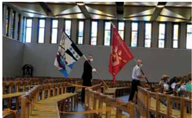
Die Fahndelelegationen aus den Wohnorten der feiernden Kinder.

Ein weiterer Schüler des Buissonnets wurde gemeinsam mit der Gruppe vorbereitet und feierte mit seinen „Gspändli“ in der Heimatpfarrei Erstkommunion. Dies