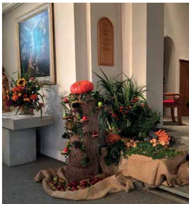
Patrozinium und Erntedankfest 2020.