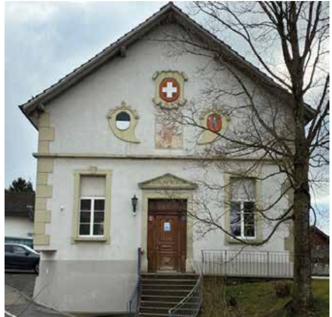
Die Nordfassade des Pfarreizentrums Tafers wird in der zweiten Jahreshälfte renoviert.

Im zweiten Teil der Versammlung ging es um die Seelsorge. Vertreter:innen von Pastoralgruppe, Pfarrteam, Ressort Kinder und Familien, Jubla, Gruppe Solidarität weltweit, sowie der Pfarrmoderator und der Jugendseelsorger der Seelsorgeeinheit Sense Mitte berichteten. Sie alle zeichneten ein positives Bild voller Hoffnung