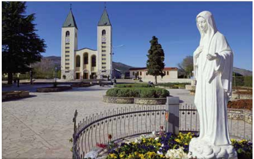
St. Jakobus Kirche mit Vorplatz und Statue der Muttergottes

Der Vatikan hat sich in den vergangenen Jahren mehrfach mit Medjugorje befasst und sich im September 2024 positiv dazu geäußert. Deshalb habe ich mich entschlossen, den Thementeil des Pfarrblattes im Marienmonat Mai diesem Wallfahrtsort zu widmen, der meiner Familie und mir sehr viel bedeutet.