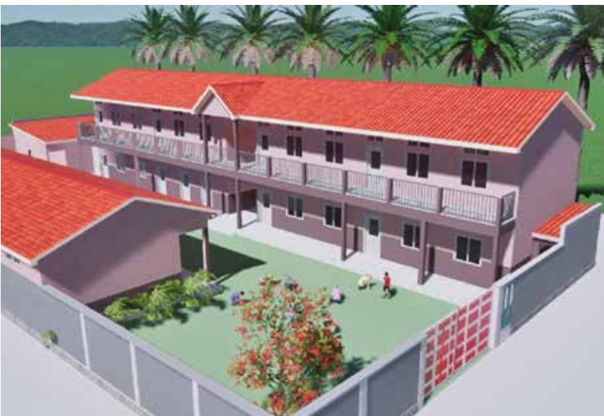
Im Dorf Kola (Kongo) bekommen viele Kinder keinen Unterricht, weil die alte Schule zu klein ist. Die Redemptoristen wollen jetzt ein Primarschulhaus mit Kindergarten bauen.

„Was können wir tun?“ fragen wir uns manchmal, wenn wir von Armut, Krieg und Naturkatastrophen hören und in den Medien Menschen sehen, die verzweifelt nach Schutz, Arbeit und Nahrung suchen. Sind wir ohnmächtig? Wir von der „Gruppe Solidarität weltweit“ wollen nicht untätig sein. Wir unterstützen und sammeln Geld für Projekte in armen Ländern. Unser Handeln rettet nicht die ganze Welt, hilft aber vielen Menschen in Armut und Not. Das ist es wert.