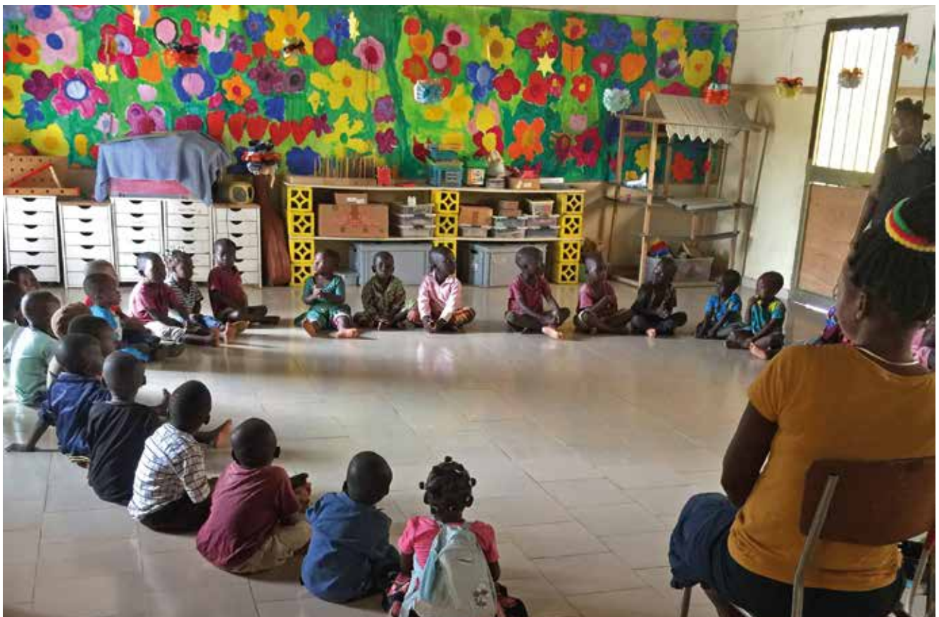
Das Kinderdorf Avenir Espoir (Togo) bietet Waisenkindern schulische und berufliche Bildung sowie umfassende Betreuung.

Texte und Fotos: Gruppe Solidarität weltweit