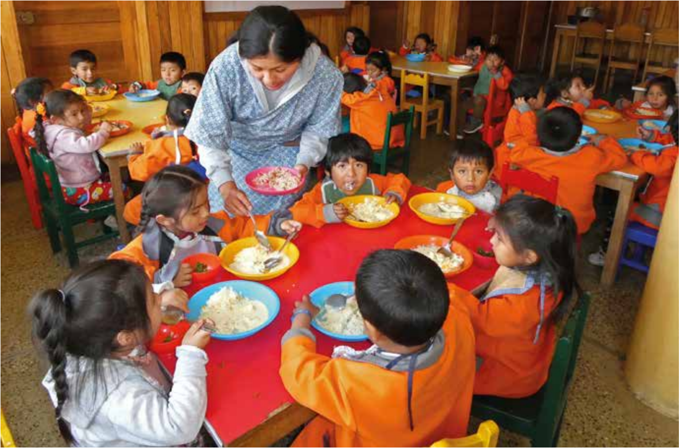
In der Kindertagesstätte Urpi-Wasi in Cusco (Peru) finden Kinder aus armen Familien Unterschlupf, Schulunterricht und medizinische Pflege.