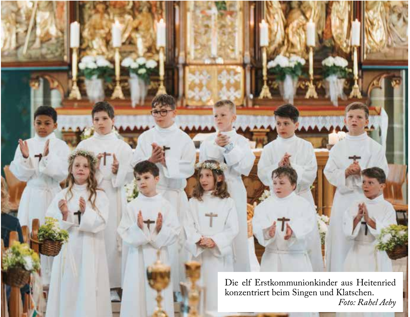
Die elf Erstkommunionkinder aus Heitenried konzentriert beim Singen und Klatschen.