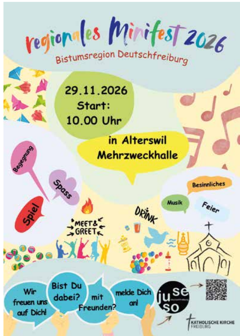
Flyer Regionales Minifest

Und genau das wollen wir auch mit dem regionalen Minifest: Klein und Gross danken für den tollen Einsatz, den sie oftmals über viele Jahre hinweg leisten. Manchmal bis ins Erwachsenenalter! Deshalb organisiert die Juseso zusammen mit einem OK das regionale Minifest in Alterswil. Mit dabei sind auch die Jubla und unser Bischof Charles Morerod, der am 29. November um 17.00 Uhr mit uns eine Messe feiert. Der Start ist um 10.00 Uhr. Macht eifrig Werbung für dieses Fest. Für einmal dürfen die Minis einfach kommen, geniessen, dabei sein, es lustig haben und neue Leute kennenlernen. Weitere Infos folgen in den nächsten Wochen.