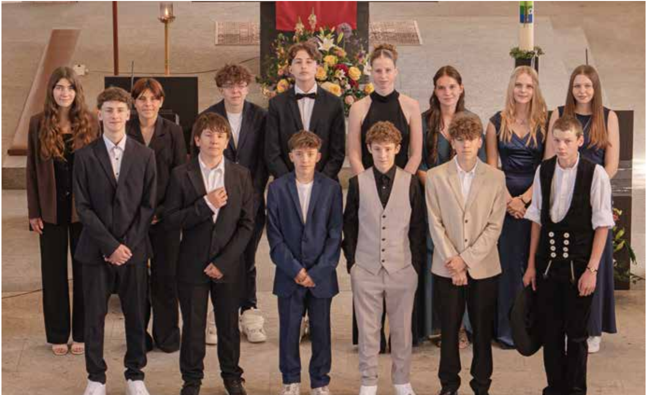
Firmung 2026 – Es war eine sehr schöne Firmung am 24. Mai mit Dekan Ludovic Nobel. Liebe Firmlinge, wir sind stolz auf euch!